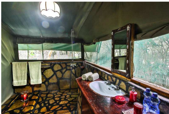
Hier eines der Badanbauten an die Schlafzelte.

Täglich finden 2 Pirschfahrten (je ca. 3-4 Stunden) im 4x4 Landrover statt. Wir haben Vollpension bei ausgezeichneter Küche im Camp.