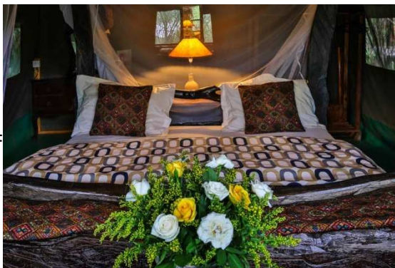
Und so sieht es in den Zelten aus. Doppelbett und am Abend, falls es wegen der hohen Lage der Masai Mara kalt werden sollte, eine Wärmflasche im Bett. Für Familien ein oder 2 Betten zusätzlich.